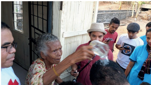
Foto 1 La nonna in un rituale di 'raffreddamento' dello spirito

In this ethnographic excerpt, the researchers describe their experience in Flores island Indonesia, where they collected visual testimonies on the role that local Camillian priests play in the care of people dealing with severe mental illness subjected to a practice of containment and/or imprisonment known as 'pasung' in bhasa Indonesia. This excerpt is part of a comparative study carried out in Ghana and Indonesia focused on exploring, through visual ethnography and participatory video, examples of collaborations between mental health professionals and traditional or faith-based healers to extrapolate what are the factors and dynamics that support such collaborations and contribute to eradicating the violation of the human rights towards people suffering with mental disorders. This excerpt provides an example from one of the few Catholic communities present in Indonesia.