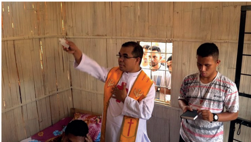
Foto 4 Padre Andi benedice il rumah aman con acqua santa (Screenshot dal film 'Harmoni: Healing Together', Colucci, 2021)

JKN copre l'assistenza sanitaria mentale, che dovrebbe essere fornita prima a livello di assistenza primaria, nei puskesmas. Tuttavia, le forniture di farmaci psichiatrici non sono sempre disponibili lì. Fortunatamente, i sacerdoti camilliani spesso procurano questi farmaci per i pazienti a loro affidati, come si vede nel caso di un altro paziente anch'esso con entrambe le gambe bloccate in una trave da molti anni nel documentario "Harmoni: Healing together" (Armonia: Guarire insieme) sviluppato da questo progetto di ricerca (Colucci, 2021). I padri hanno costruito una collaborazione con specialisti locali, inizialmente con un neurologo con molta esperienza e, due anni fa, con una psichiatra che aveva appena iniziato a lavorare a Sikka, e con diversi medici puskesmas per garantire la fornitura di farmaci. Dopo che i medici li hanno prescritti, i sacerdoti camilliani acquistano i farmaci nelle farmacie private locali per conto del paziente. I sacerdoti forniscono anche un sostegno per il sostentamento alle famiglie dei pazienti dando loro capre e galline. Questo non solo migliora le finanze della famiglia, ma anche il loro morale. Una dinamica familiare positiva dopo il rilascio dal pasung è vitale per il recupero delle persone che stanno aiutando (Yunita et al., 2020).