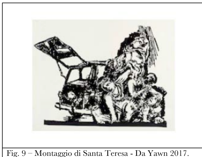
Fig. 9 – Montaggio di Santa Teresa - Da Yawn 2017.

La processione, la sfilata, il corteo, formano dunque una sequenza continua per la linearità materiale della successione di una figura o gruppo di figure all'altra, che rinvia certo a un senso unitario, complessivo, ma ottenuto attraverso un montaggio di elementi eterogenei. Una sorta di cifra emblematica di questa procedura è rappresentata dalle scene (22-23-24), un "amalgama" fra il corpo di Aldo Moro trovato in una Renault (foto ANSA 9 maggio 1978), Santa Teresa in Estasi (Bernini, 1647-1652) e Romani che uccidono dei barbari (dal sarcofago "Grande Ludovisi", 260 d.C.). Della celebre foto in bianco e nero del ritrovamento di Moro in via Caetani rimane quasi lo scheletro della parte posteriore dell'auto, la Santa Teresa, privata dell'angelo che le trapassa il cuore con il dardo divino, esprime certo più dolore che piacere, mentre le celebratissime pieghe del suo manto sono formate da una mischia in cui i Romani "civilizzati" uccidono i barbari.