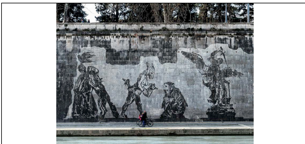
Fig. 8 – La Meretrice di Babilonia e Roma “vedova” del papato – Da Crescentini 2020.

Fra i riferimenti a questi drammatici eventi, particolarmente curiosa è la coppia di figure (18/19). Qui è rappresentata la cosiddetta Meretrice di Babilonia, leggendaria creatura mostruosa con testa di asino e corpo di donna (e molto altro...) emersa dalla piena del Tevere 1495. Nel ridisegno di Kentridge è munita di una caffettiera Bialetti, e sembra offrire il caffè a un’altra rappresentazione simbolica di Roma, Roma “vedova” in seguito allo scisma d’Occidente (1378), forse a suggerire al temporaneo abbandono da parte del papato un conforto offerto dal futuro (mostruoso: uno dei significati attribuiti all’immagine riguardava proprio la corruzione papale).