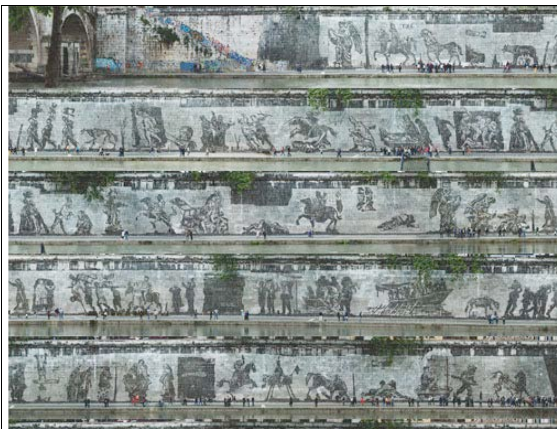
Fig. 2 – Montaggio fotografico in verticale della sequenza lineare del fregio, fonte Web.

Un'osservazione generale sulla struttura dell'opera riguarda la tensione che essa manifesta a più livelli tra continuità e discontinuità . Da un lato, come abbiamo visto, il fregio presenta tutta una serie di caratteristiche che rinviano alla continuità: a livello semantico è dominato da un'unica grande isotopia, che è quella espressa dal titolo, così come, sul piano dell'espressione, c'è l'inconfondibile unità di stile data dal tratto dell'artista. Inoltre, i modelli di riferimento intertestuali – per esempio la Colonna Traiana – e intratestuali, come il cinema delle origini o il teatro praticati e costantemente rivisitati da Kentridge (Burgio 2014), rinviano sempre a una continuità globale, che all'analisi si rivela ottenuta per discontinuità locali.