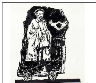
Fig.4 – Hailè Selassie e il suo gesto simbolico per l'unità africana - Da Yawn 2017.

Troviamo forme di ironia (la lupa del Campidoglio che al posto di Romolo e Remo ha due vasetti, uno bianco e uno nero; il celebre abbraccio di Mastroianni e la Ekberg da Roma di Fellini in una Fontana di Trevi trasformata in vasca con doccia; le ruote o le rotelle aggiunte a vari monumenti (per trasportarli qui!); di decostruzione (l'affresco che rappresenta Mussolini a cavallo tempestato di proiettili) (26); la testa di Cicerone smontata e poi frantumata, in seguito alla sua proscrizione (8 e 27), di sottrazione di particolari: ad esempio (3), il carro trionfale preso dalla (modestissima) fiction Roma della HBO/BBC (2005), con la corona di lauro sostenuta da uno schiavo ma senza la figura del vincitore celebrato, quindi proposto come uno schema generale. Interessante inoltre la ricorrenza di gesti – altro tema fondamentale nella storia, dell'arte e non solo: oltre a quelli già citati, vi sono recisioni di gambe o di braccia: nella statua di Marco Aurelio (2), nel Pompeiere di San Lorenzo (15), in San Pietro Crocifisso (43) o simbolizzazioni , come nella immagine di Hailè Selassie, fondatore dell'Organizzazione dell'Unità Africana (33).