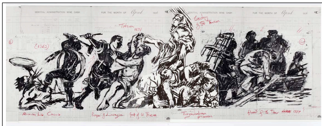
Fig. 10 – William Kentridge, Studio preparatorio per Triumphs and Laments .

Troviamo invece una riflessione di Kentridge sul Montaggio della Storia di nuovo in una delle sue Lezioni di disegno , la Seconda, intitolata "Una breve storia delle rivolte coloniali", che penso si possa utilmente adottare anche in riferimento a questo lavoro. Ripercorrendo mentalmente un proprio excursus storico, Kentridge così conclude: