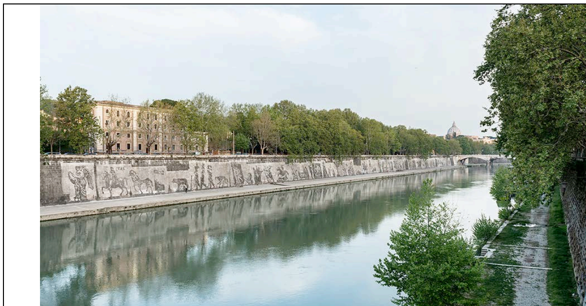
Fig.1 – Veduta di Triumphs and Laments di William Kentridge, foto di Luciano Sebastiano.