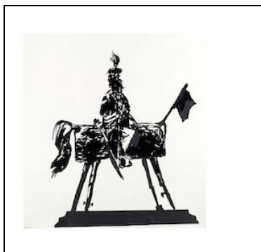
Fig. 3 - Vittorio Emanuele in posa per il suo ritratto equestre su un cavalletto di legno – Da Yawn 2017.

Troviamo forme di ironia (la lupa del Campidoglio che al posto di Romolo e Remo ha due vasetti, uno bianco e uno nero; il celebre abbraccio di Mastroianni e la Ekberg da Roma di Fellini in una Fontana di Trevi trasformata in vasca con doccia; le ruote o le rotelle aggiunte a vari monumenti (per trasportarli qui!); di decostruzione (l'affresco che rappresenta Mussolini a cavallo tempestato di proiettili) (26); la testa di Cicerone smontata e poi frantumata, in seguito alla sua proscrizione (8 e 27), di sottrazione di particolari: ad esempio (3), il carro trionfale preso dalla (modestissima) fiction Roma della HBO/BBC (2005), con la corona di lauro sostenuta da uno schiavo ma senza la figura del vincitore celebrato, quindi proposto come uno schema generale. Interessante inoltre la ricorrenza di gesti – altro tema fondamentale nella storia, dell'arte e non solo: oltre a quelli già citati, vi sono recisioni di gambe o di braccia: nella statua di Marco Aurelio (2), nel Pompeiere di San Lorenzo (15), in San Pietro Crocifisso (43) o simbolizzazioni , come nella immagine di Hailè Selassie, fondatore dell'Organizzazione dell'Unità Africana (33).