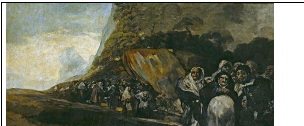
Fig. 5 – Pellegrinaggio alla fonte di Sant'Isidro , Francisco Goya, 1820-1823, Madrid, Museo del Prado.

Consideriamo alcuni riferimenti colti che rinviano alla totalità del lavoro. Il sottotitolo dell'opera, Procession , ci riconnette a un quadro di Goya dichiarato da Kentridge fondamentale per la struttura di tante sue opere, il Pellegrinaggio alla fonte di Sant'Isidro (1820-1823, Madrid Museo del Prado). Nelle sue lezioni sul disegno, l'artista confessava di essersi sempre chiesto dove effettivamente andasse e potesse finire quella lunga e tortuosa teoria di anime attonite (Kentridge 2014). Questo riferimento ci fa riflettere sull' orientamento delle figure, che muta più volte nel corso della « sfilata », come osservato anche dalla Guida nella citazione che precede.