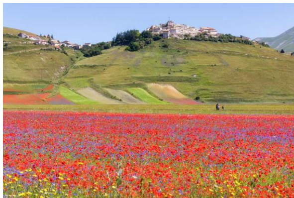
Fig. 4 – La Piana di Castelluccio e il borgo durante la fioritura.

giugno, durante la quale la Piana si riempie di colori; la ruvidezza di un altopiano a 1400 metri, impervio e difficile da vivere, eppure faticosamente antropizzato nel corso dei secoli.