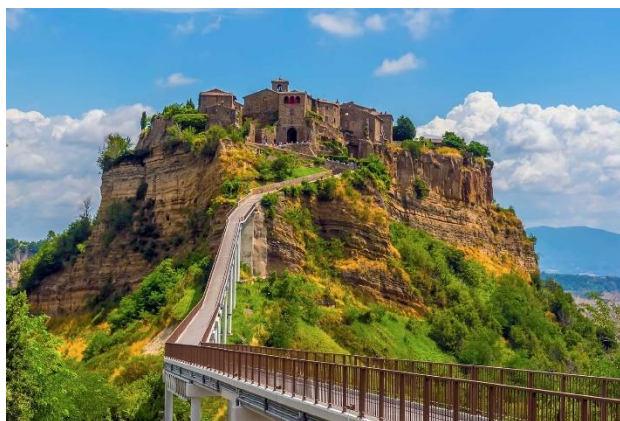
Fig. 1 – Civita di Bagnoregio, una delle forme architettoniche che meglio esemplifica l’idea di corpo-immagine dei borghi italiani.