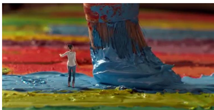
Fig. 7 – La ragazza rischia di essere travolta dal pennello gigante che traccia longitudinalmente i colori della Piana.