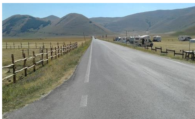
Fig. 12 – Castelluccio, domenica 2 luglio 2022. Il post su Facebook recita: “se non fosse per qualche motociclista, sembrerebbe una domenica di novembre”.