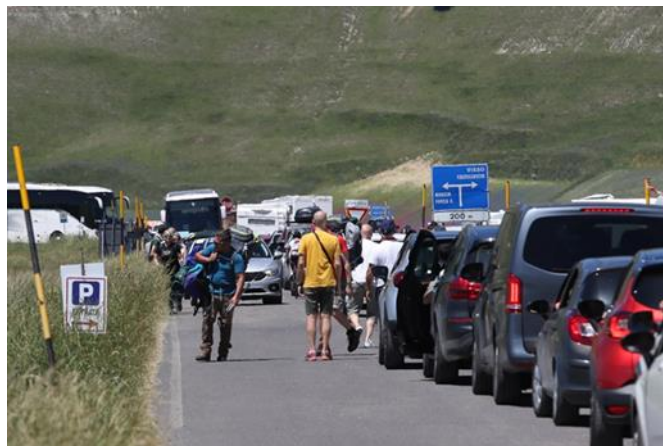
Fig. 9 – La coda di macchine sulla Piana di Castelluccio il 5 luglio 2020.

spazi larghi” (Ansa 2020). Oggi però sembra davvero troppo: un serpente di macchine, praticamente ferme, sull’unica strada che taglia in due la Piana per condurre al borgo.