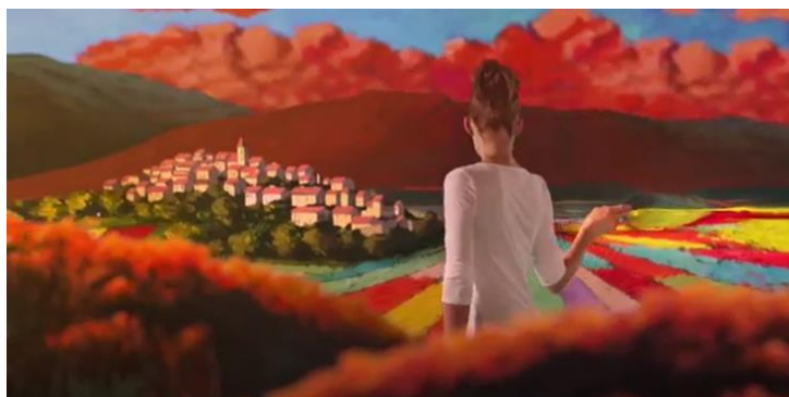
Fig. 6 – La ragazza affonda le dita nei colori della Piana, diventando attore partecipe del divenire quadro del paesaggio.

soggetto in trasformazione: l'attore può diventare piccolo e farsi travolgere dalla maestosità del paesaggio, subito dopo impugnare un pennello per disegnare il paesaggio, ma al contempo sovradimensionarsi, ovvero divenire letteralmente una sorta di gigante che è in grado di sovrastare la Piana e il borgo di Castelluccio di Norcia, ottenendo un punto di vista inedito, unico. L'attore vede, è immerso, ma allo stesso tempo si guarda vedere, acquisendo consapevolezza della straordinarietà dell'esperienza.