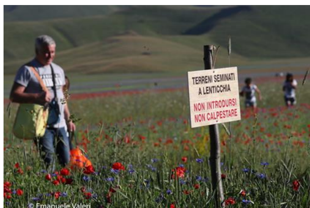
Fig. 10 – Durante le domeniche più affollate, i cartelli di divieto non bastano ad evitare che molti si spingano dentro la Piana e calpestino i campi coltivati della fioritura.