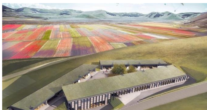
Fig. 11 – La struttura commerciale temporanea Deltaplano di Castelluccio vista dall'alto (render di progetto) (©Architetto Francesco Cellini).