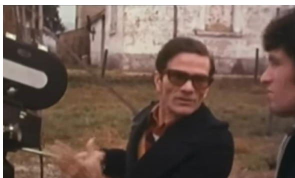
Fig. 2 – Una sequenza del documentario “Pasolini e la forma della città”, in cui il regista si rivolge a Ninetto Davoli.

ecco che la forma della città, il profilo della città, la massa architettonica della città è incrinata, è rovinata, è deturpata da qualcosa di estraneo. Quella casa che si vede là a sinistra, ecco, la vedi? Ecco, questo qui è un problema, di cui io parlo con te [...] che mi hai seguito in tutto il mio lavoro e mi hai visto molto volte alle prese con questo problema [...] di filmare una città nella sua interezza. E quante volte mi hai visto soffrire, smaniare, bestemmiare, perché questo disegno, questa purezza assoluta della forma della città era rovinata da qualcosa di moderno, che non c'entrava.