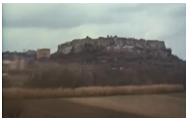
Fig. 3 – Il borgo di Orte ripreso da Pasolini con l'edificio alla sua sinistra che, leggermente distaccato dall'insieme, ne rovina la “forma pura”.

In questo frammento è abbastanza facile rilevare l'eco della critica di Pasolini verso i processi di modernizzazione, che investono gli ambienti urbani e i loro abitanti. L'idea di mutazione antropologica può essere vista infatti come storicizzazione degli effetti del consumismo e della massificazione della società industriale, a cui viene contrapposta la società contadina e la sua cultura materiale come polo di saperi culturale e territoriale. Nella critica di Pasolini, la forma estetica di Orte è un oggetto a sé, armonico, chiuso e coerente: una “forma perfetta e assoluta” caratterizzata da “perfezione stilistica” che viene rovinata, deturpata da un edificio appena costruito “qualche cosa di moderno, da qualche corpo estraneo che non c'entrava”. Il discorso sembrerebbe a questo punto scivolare sul terreno di una critica superficiale, ma invece proseguendo nel video possiamo avere l'impressione che Pasolini colga perfettamente la dimensione più profonda del problema, quando afferma che, in realtà, ciò che lo interessa è: “il rapporto fra la forma della città e la natura. Ora il problema della forma della città e il problema della salvezza della natura che circonda la città, sono un problema unico”.