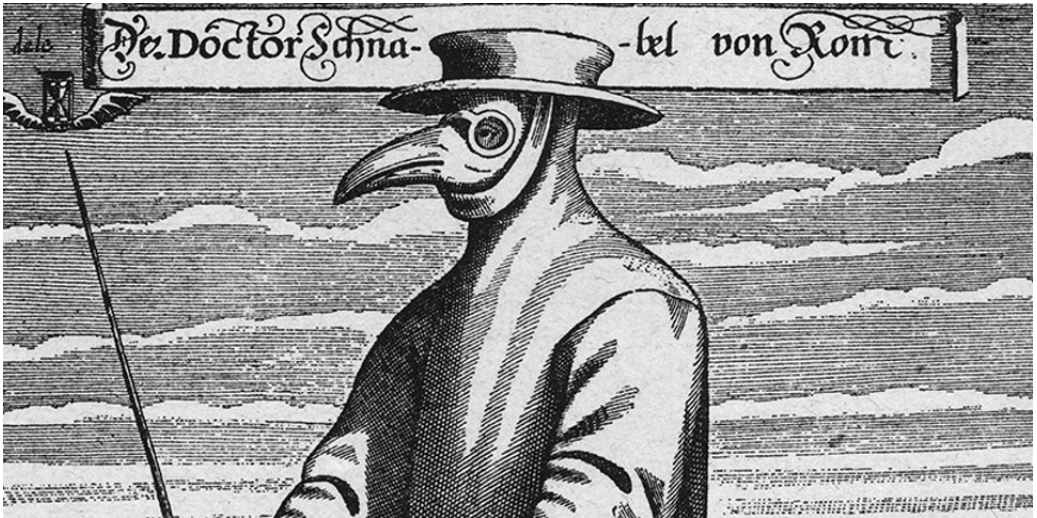
Un «medico» con la classica maschera a forma di becco, nel quale erano inserite spezie che si pensava purificassero l'aria evitando i contagi da peste, in una stampa di metà Seicento