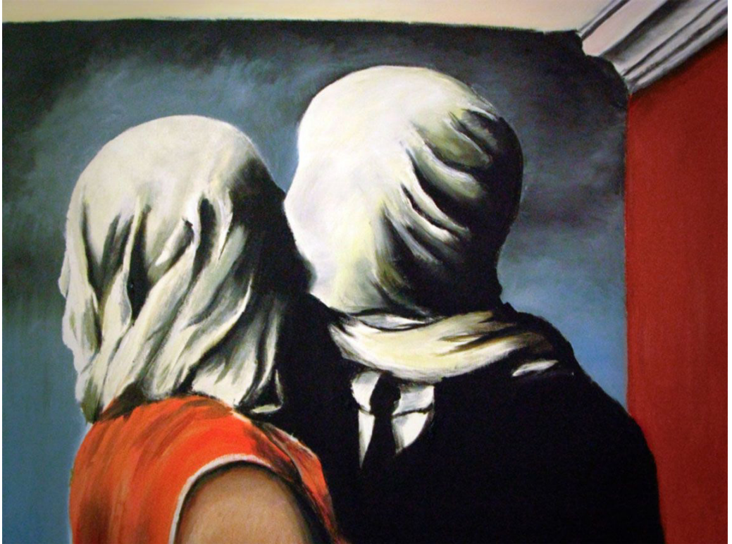
R. Magritte, Les amants (MoMa – New York)