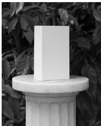
Ora provo con la gravità

I miei modi preferiti per tenere viva la presenza sono due: quadrettare fogli a mano e stilare liste. 55 grotte nasce dall'intreccio di questi esercizi (come buona parte del mio lavoro artistico): ho preso nota, una dopo l'altra, delle abitazioni che compaiono nella mia autobiografia. Cinquantacinque. Poi ho tracciato righe orizzontali e verticali a matita, su altrettanti fogli di carta di bambù, formato A4. Infine, ho iniziato a dipingervi le case, nell'ordine indicato dalla lista.