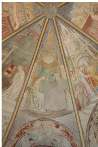
1. Masolino da Panicale, Incoronazione della Vergine , Castiglione Olona, Collegiata dei Santi Stefano e Lorenzo.