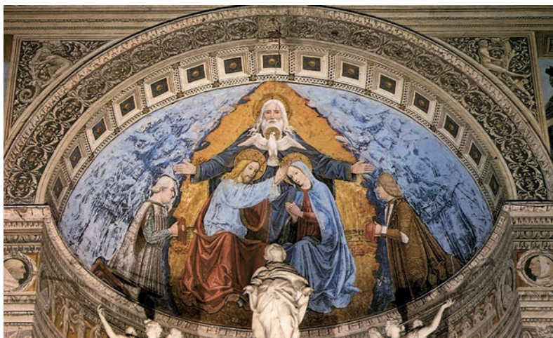
7. Bergognone, Incoronazione della Vergine , Certosa di Pavia, Basilica di Santa Maria delle Grazie.