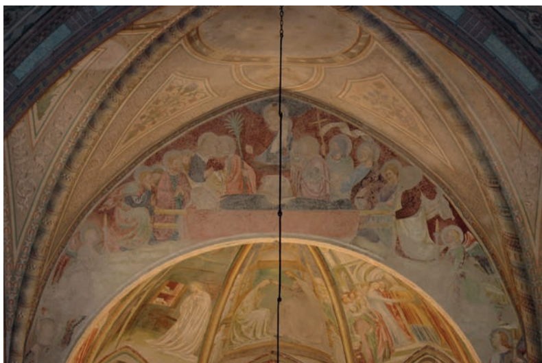
2. Paolo Schiavo, Dormitio Virginis , Castiglione Olona, Collegiata dei Santi Stefano e Lorenzo.