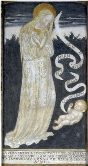
3. Madonna dell'Umiltà, Milano, Chiesa di Santa Maria Bianca della Misericordia in Casoretto.