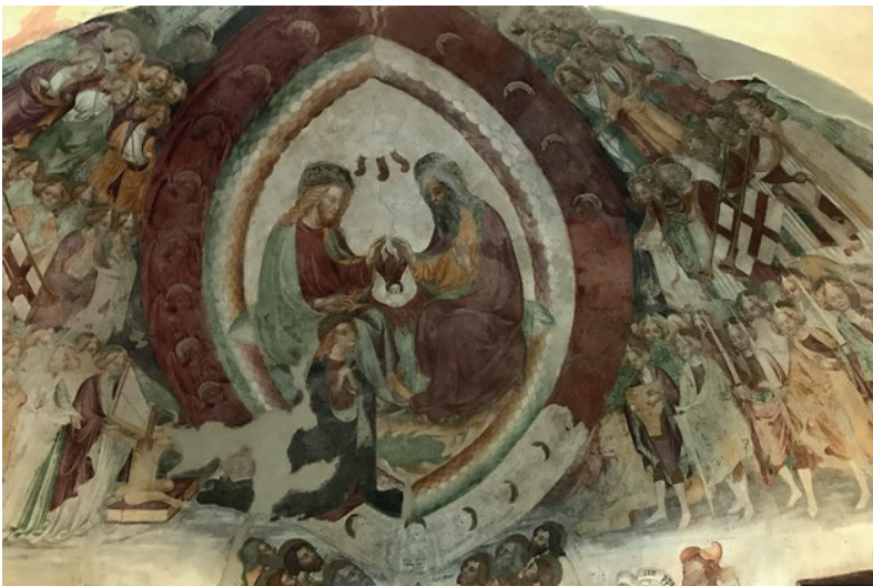
4. Incoronazione della Vergine, Casatenovo Brianza, Oratorio di Santa Margherita.