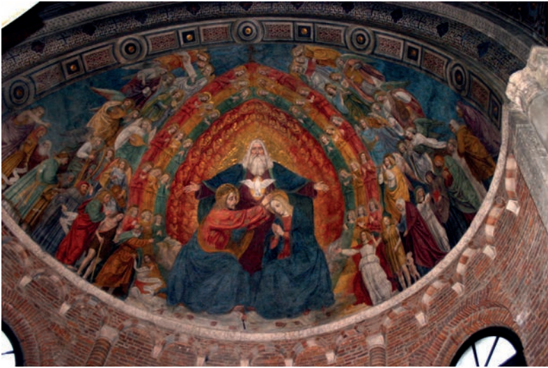
8. Bergognone, Incoronazione della Vergine , Milano, Basilica di San Smpliciano.