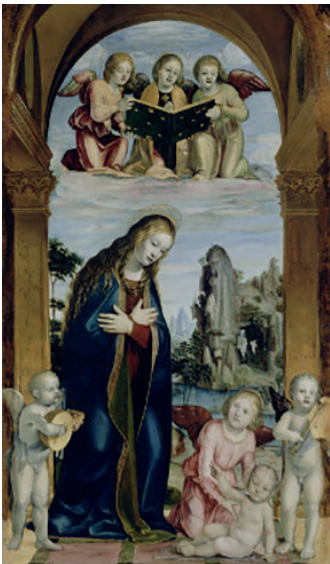
9. Bernardo Zenale, Madonna dell'Umiltà , Malibu, The J. Paul Getty Museum.