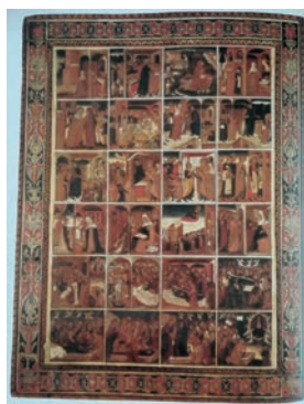
6. Storie della Vergine , Monza, Duomo di San Giovanni Battista.