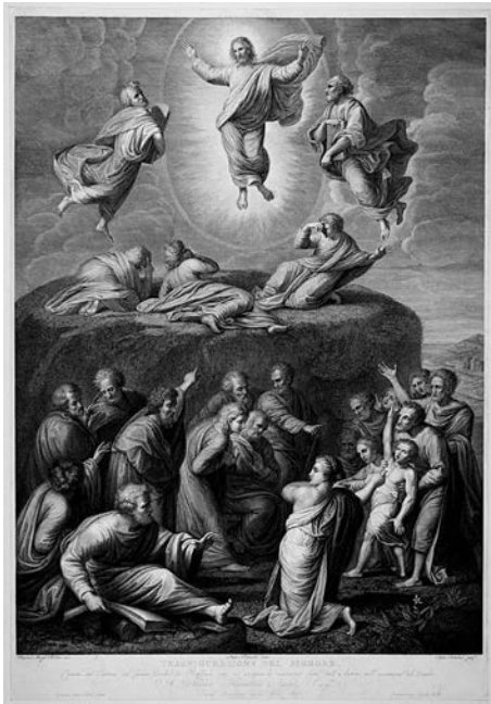
7. Pietro Bettelini (incisore), Raffaello Sanzio (artista), Trasfigurazione , fine sec. XIX, collezione privata.