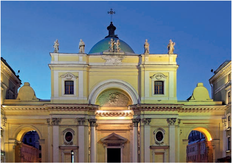
18. Pietro Antonio Trezzini (progetto), Antonio Rinaldi (ultimazione), cattedrale di Santa Caterina d' Alessandria, 1738-1783, facciata, particolare, San Pietroburgo.