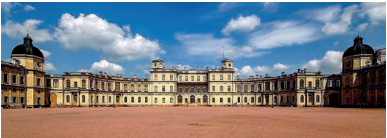
19. Antonio Rinaldi e Vincenzo Brenna, reggia di Gatčina, 1766-1781, Gatčina.