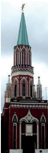
12. Luigi Rusca, torre Nikolskaya, 1806, Cremlino, Mosca.