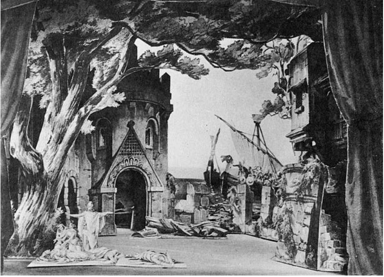
9. Angelo Quaglio il Giovane, scenografia per Tristan und Isolde , 1865.