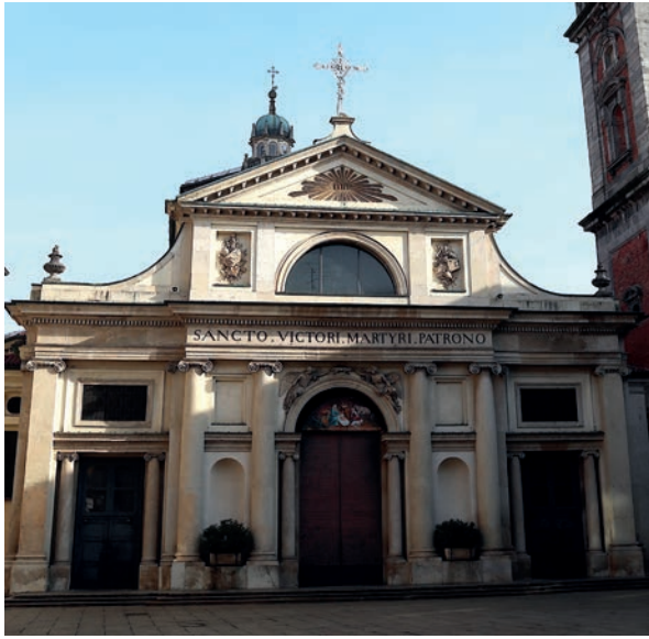
3. Leopoldo Pollack e Pietro Gilardoni, basilica di San Vittore, 1792, Varese, facciata, particolare.