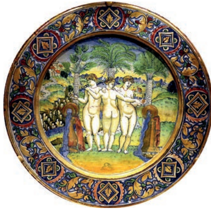
4. Giorgio Andreoli, Le tre grazie , 1525, Cleveland Museum of Art, Cleveland.