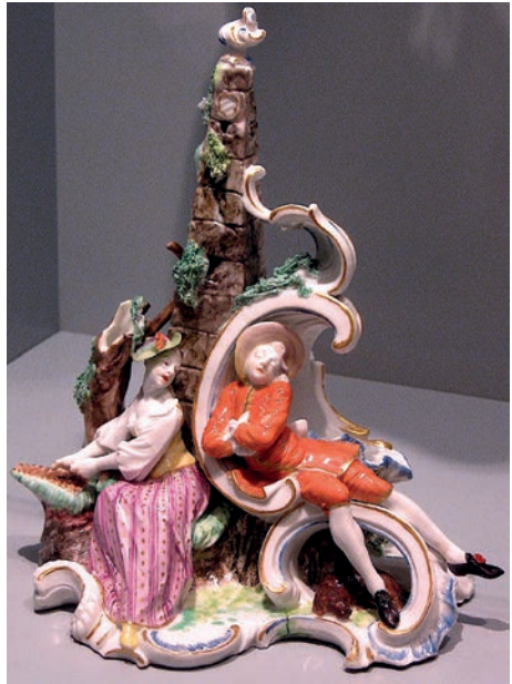
5. Francesco Antonio Bustelli, Il sonno disturbato , 1756, Bayerisches Nationalmuseum, München.