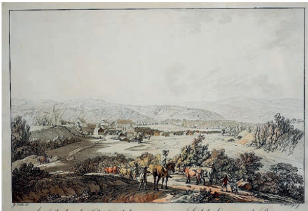
8. Domenico Artari, Vista dal mercato elettorale di Miesbach, Dodici vedute della Baviera , 1805 ca., collezione privata, Mannheim.